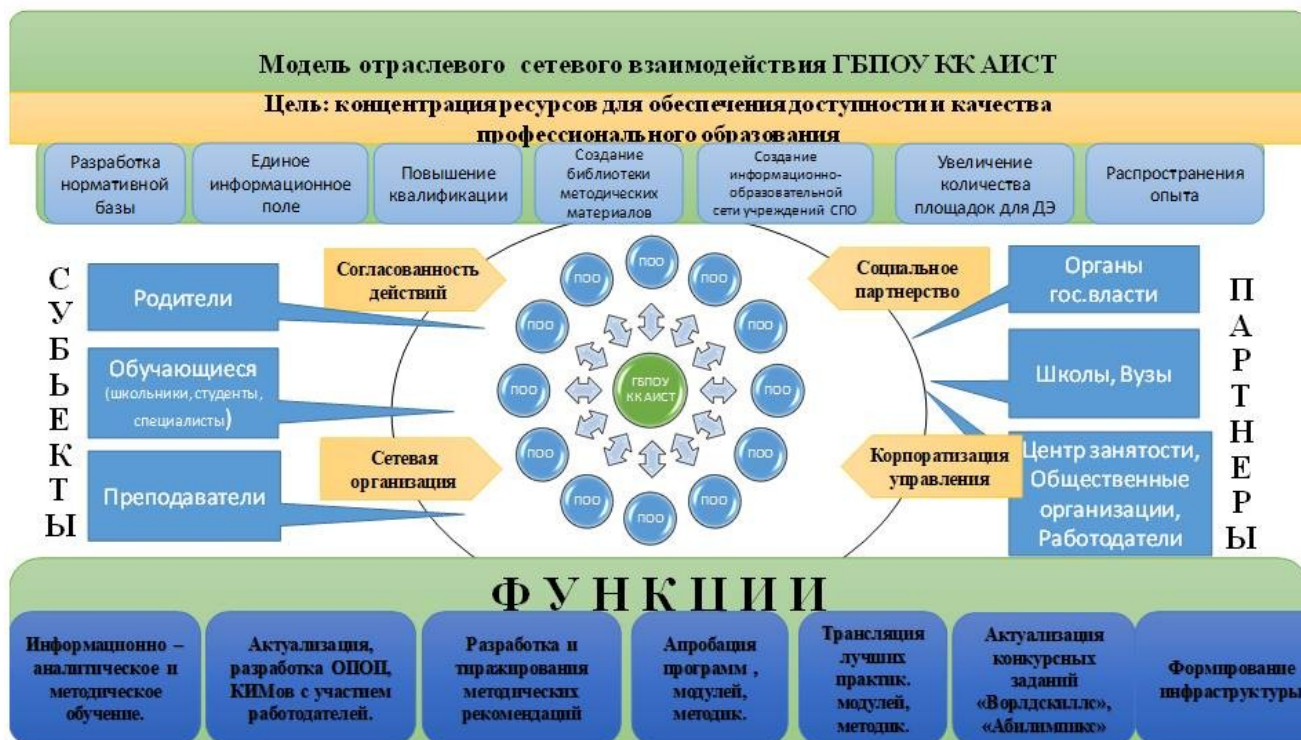
Схема 1.5.1. Механизмы отраслевого сетевого взаимодействия